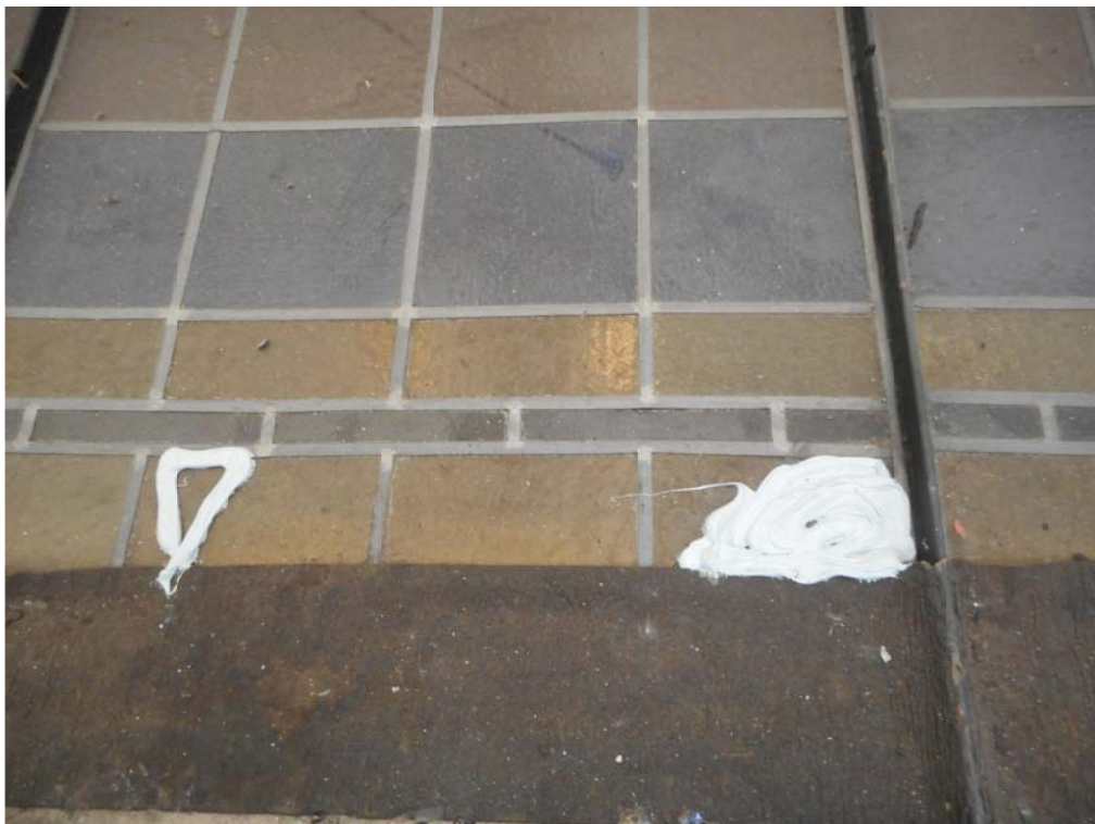
CUADRANTE 7, PIEZA 12C . Reparaciones puntuales con silicona.