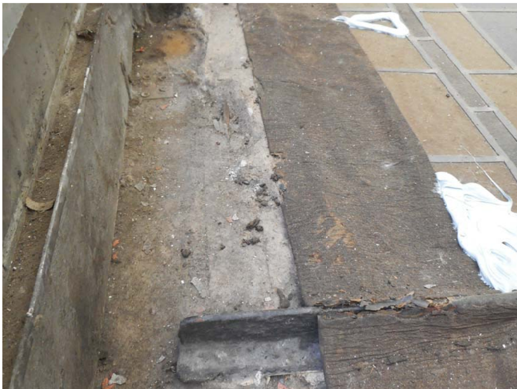
CUADRANTE 7, PIEZA 12C. Tela adherida que proyecta sombras, y reparaciones con silicona.