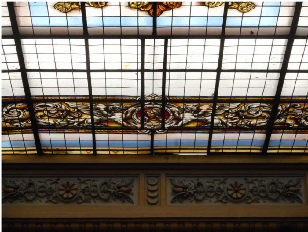
CUADRANTE 8. Teselas partidas y encuentro irregular con cornisa.